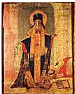
Ο ανθενωτικός Μάρκος Ευγενικός

επαφές και συμβούλια για αυτό το θέμα μεταξύ 1054 και 1204. Μια σειρά ειρηνικές απόπειρες, το έργο των οποίων καταστρατηγήθηκε και καταργήθηκε μετά την 'Αλωση του 1204.