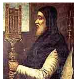
Ο καρδινάλιος Βησσαρίων

Η έριδα μεταξύ Ενωτικών και Ανθενωτικών ήταν κυρίαρχη στη ζωή του Βυζαντίου μετά το 1204, και θα μπορούσε να υποστηριχθεί πως πολλά θεολογικά ζητήματα που εξετάστηκαν στην αλαιολογία περίοδο δεν ήταν παρά οι άλλες όψεις του αυτού ζητήματος. Μεγάλα πνεύματα --από την εποχή των συνταρακτικών διαλόγων Γρηγορίου Παλαμά και Βαρλαάμ-- αντιπαρατέθηκαν με επιχειρήματα σε ένα φλογερό διάλογο, τον οποίο παρακολουθούσε με τεράστιο ενδιαφέρον ο πιστός λαός. Οι διαιρεμένοι λόγοι της τελευταίας εποχής είχαν επικεφαλής οι μεν ενωτικοί τον Βησσαρίωνα, μαθητή του Πλήθωνα που σεβόταν αλλά δεν ασπαζόταν τις απόψεις του δασκάλου του, οι δε ανθενωτικοί τον Μάρκο τον Ευγενικό και, όταν αυτός κοιμήθηκε, τον Γεννάδιο (Γεώργιο) Σχολάριο, κάποτε ενωτικό.