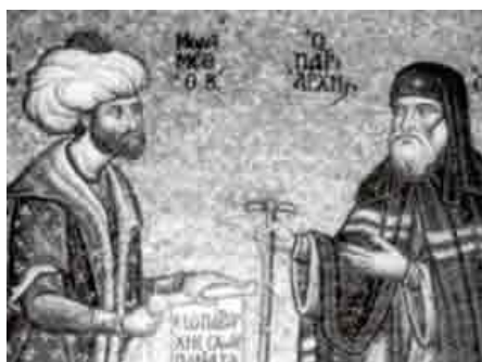
Ο σουλτάνος παραδίδει στο Γεννάδιο τον πατριαρχικό θρόνο

Μετά το τριήμερο της λεηλασίας, ο Μωάμεθ ζήτησε από τους εναπομείναντες κληρικούς να εκλέξουν Πατριάρχη, επιθυμώντας να μετατρέψει την Εκκλησία σε βιλαέτι, δηλαδή διοικητικό οργανισμό των ορθοδόξων, μέσω του οποίου θα μπορούσε να ζητά ευθύνες από τον εκάστοτε Πατριάρχη για τα πεπραγμένα των μελών της Εκκλησίας.